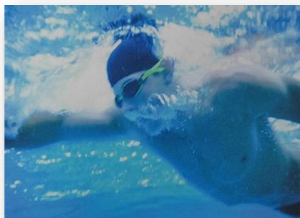
Мастер спорта СССР Евгений Косяненко на дистанции.