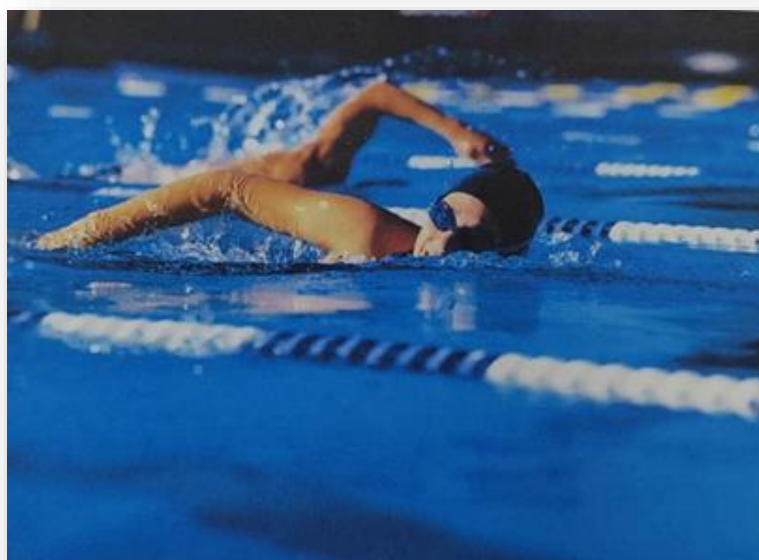
Мастер спорта СССР Майя Двуреченская